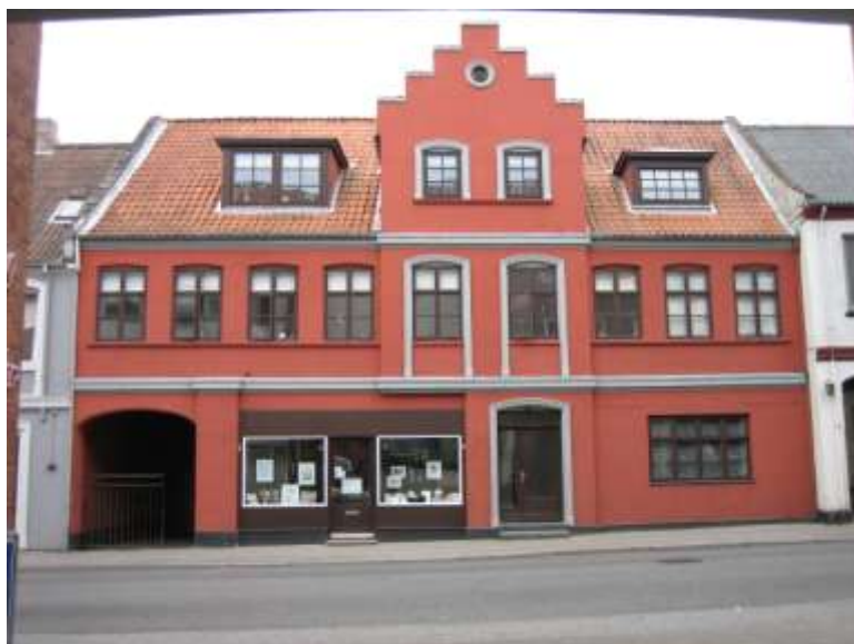
Storegade 17 i Varde som det så ud i 2006

Efter giftermålet slog det unge par sig ned i Varde. De fik lejlighed på 2. sal i den ejendom på Skoubogade 65, som hans forældre havde erhvervet.