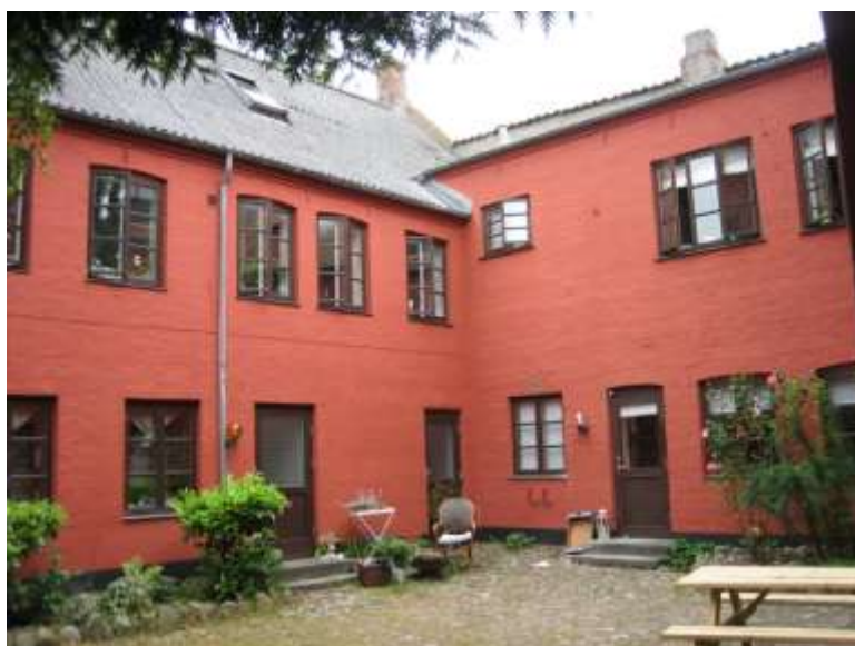
Storegade 17 sidebygning og baghus

Det var en relativ stor ejendom bestående af forhus, sidehus og baghus omkring en brolagt gård.